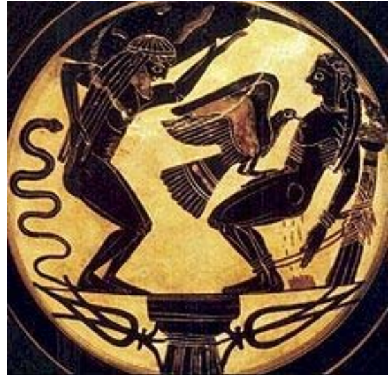
Prometheus mit dem Adler Ethon und Atlas (Lakonische Schale, ca. 530 v. Chr.)